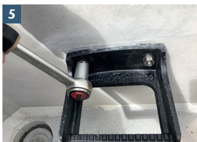
5 Skruva på stegen med ett vridmoment på 25 Nm.