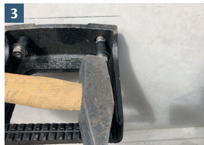
3 Placera ankaren genom hålen i stegen.