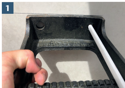
1 Placera stegen och markera fästpunkterna.