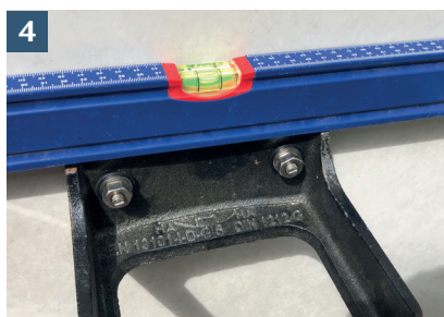
4 Justera stegen.