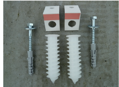
Wandfixierungsset zur Hand nehmen