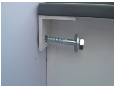
Schraube mit Beilagscheibe in Spiraldübel eindrehen