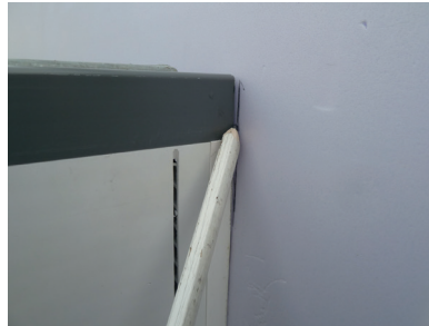
Außenkante des Aufstockelementes (Seitenschenkel) anzeichnen