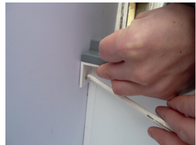
Seitenschenkel gegen äußere Markierung (Punkt 2) drücken und Befestigungspunkt anzeichnen