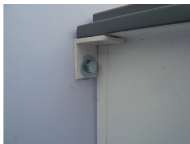
Schraube handfest anziehen