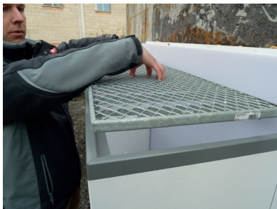
Rost mittig anheben und entnehmen