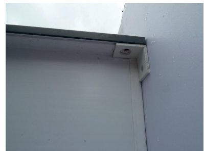
Winkel unter die Rostaufgabe kleben