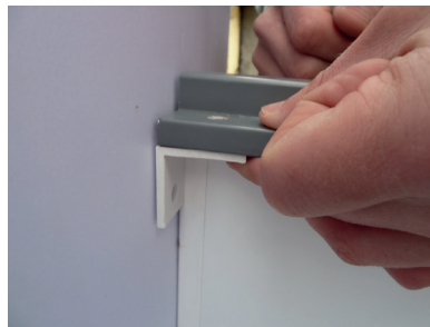
Kunststoffwinkel anhalten. Große Bohrung zeigt nach oben