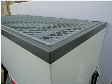
Rost in Aufstockelement einlegen