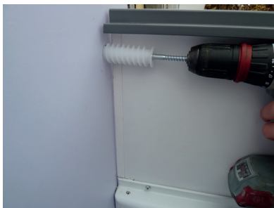
Spiraldübel mithilfe der mitgelieferten Schraube komplett eindrehen